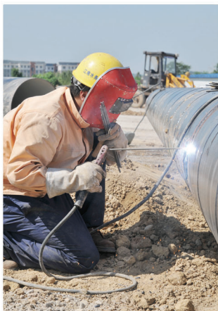
科技大道DN800管施工现场