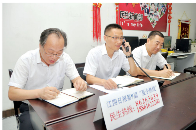
图片新闻。7月16日,公司工程管理部、质量管理部、客服中心负责人一行赴江阴日报社参加“夏令热线”栏目,为广大市民解答用水疑惑。(胡菁)

入夏以来,为减少极端天气带来的不利影响,公司抢修队早作准备、早定方案,配备充足的防风、防雨物资,抢修人员随时出发,抢修设备随时待命,确保用户能安心、放心、舒心用水。(沈斌)